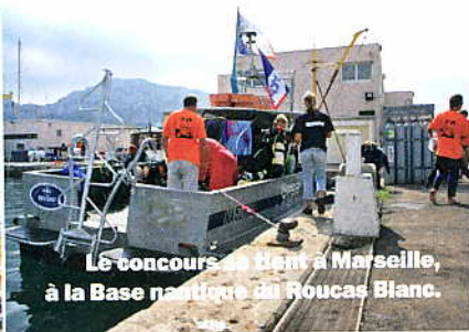
Le concours se tient à Marseille, à la Base nautique du Roucas Blanc.

Du 16 au 18 novembre 2007 www.challenge-de-marseille.com BLUE LAGOON MARSEILLE 45 rue Montgrand, BP 222 – 13178 Marseille cedex 20. Tél. : 04 91 55 08 69